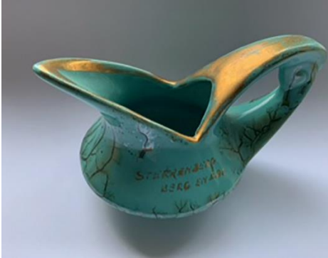
Kannetje uit de souvenirwinkel van de uitkijktoren 'de Sterrenberg'.

Bestemmingsplan 'Stuwwal en beschermd dorpsgezicht Ubbergen' is op 27 juni 2013 vastgesteld door de gemeenteraad van de toenmalige gemeente Ubbergen en is onherroepelijk. De locatie van de Sterrenbergtoren ligt in dit gebied. Zelfs het plekje waar de toren kan komen is specifiek op kaart aangeduid, net als het pad dat er vanaf de Oude Bosweg heenleidt.