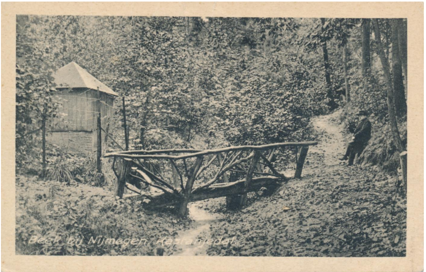
In dit gebouwtje stond de Breurpomp.

Daar waar het huidige bruggetje in het Kastanjedal ligt werd de Breurpomp geplaatst in een eenvoudig gebouwtje. Het hoogteverschil van +/- 1,50 meter was voldoende voor de pomp om het water naar grotere hoogtes te pompen.