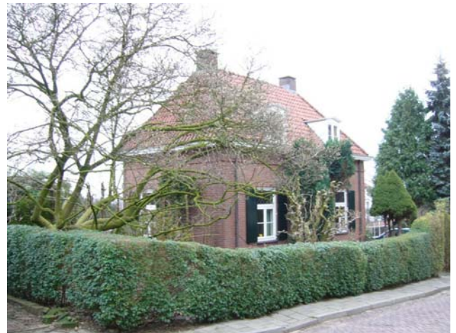
Beek, Kerkberg 16. Vml. kosterwoning St. Bartholomeuskerk. Ontw. B.W.A. Goddijn 1950.

schoorstenen). De kosterwoning is zeer goed bewaard gebleven, met o.a. de originele luiken en ligusterhagen.