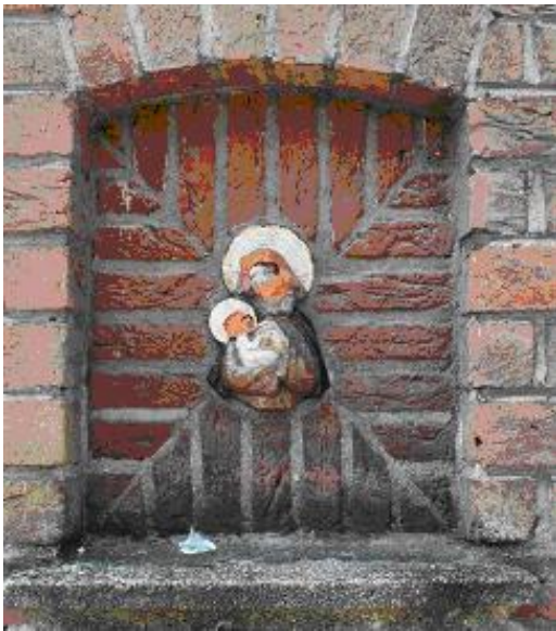
Beek, Nieuwe Holleweg 27. Vernield Sint Jozef-reliëfje. 1948.