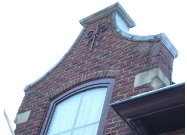
Beek, Nieuwe Holleweg 25, detail dakkapel. De meerkleurige baksteen, het muurijzer, het getoogde raam en kalkstenen schouderstuk zijn typerend voor de wederopbouw in traditionalistische stijl.

Fraaie detaillering is terug te vinden in het siermetselwerk onder de daklijsten en in de blindvelden boven de meerruitsvensters, evenals in het ontwerp van de deuren. De tuitgevels en