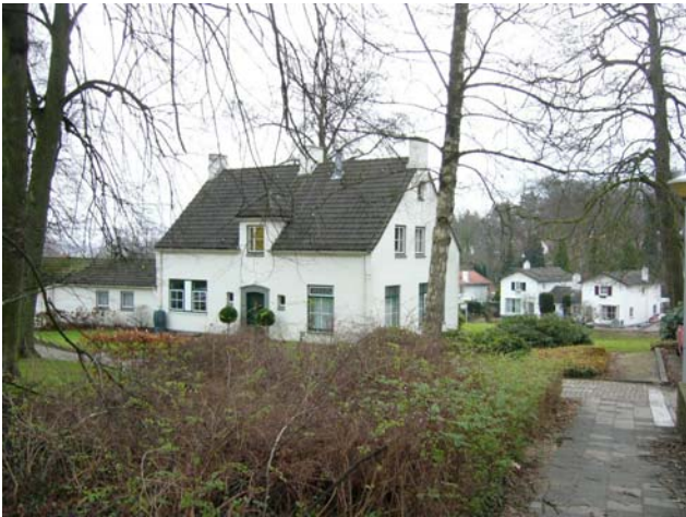
Beek, Nieuwe Holleweg 12. Achtergevel vml. dokterswoning Kalorama (ontw. J.G. Deur & C. Pouderoyen 1950) met op de achtergrond Nieuwe Holleweg 33-35 (ontw. J.A.J. van den Boogaard 1951).

raampartijen, terwijl de muurvlakken tussen de ramen voorzien waren van siermetselwerk. Helaas gingen de oorspronkelijke villa en de nieuwe uitbreiding door brand verloren in 1959.