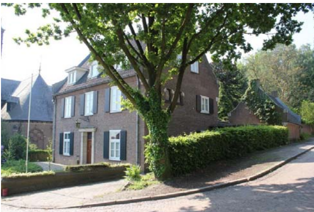
Beek, Kerkberg 3. Pastorie St. Bartholomeuskerk, ontw. B.W.A Goddijn 1947.

Aan de Kerkberg 3 werd de verwoeste pastorie uit 1804 (in 1923 verbouwd door gemeentearchitect J.A.J. van den Boogaard) geheel herbouwd in kleinere vorm. De pastorie in de stijl van de Delftse School heeft tuitgevels en schouderstukken op natuurstenen consoles. Ook de kleine gepaarde rondboogramen aan de zijgevel zijn opvallend. Er waren behalve slaapkamers voor pastoor en kapelaan en hun personeel ook een spreekkamer en een wijnkelder. De tuin was ommuurd. In het bijgebouw bevonden zich een berging en bijkeuken. De pastorie heeft nog veel oorspronkelijke elementen behouden, zoals de luiken en een fraaie smeedijzeren lantaarn boven de (in natuursteen omlijste) voordeur.