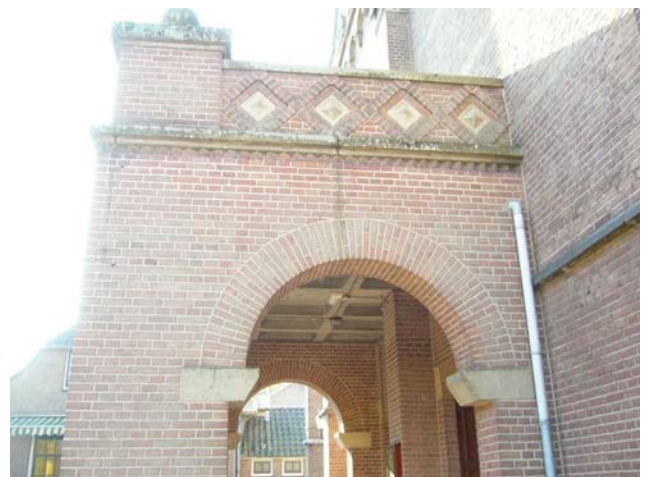
Beek, Kerkberg 1. Peristyle St.Bartholomeuskerk, ontw. B.W.A. Goddijn 1952.

Bartholomeuskerk werd in september/oktober tijdens Operatie Market Garden door granaten getroffen en brandde grotendeels uit. Daarbij gingen alle gebrandschilderde ramen en interieurelementen af. Ook de sacristie en de pastorie, met het kerkarchief, gingen verloren. De eerste jaren na de oorlog kon de kerk na enkele noodmaatregelen gebruikt worden, maar er werden plannen ontwikkeld voor een ingrijpende inwendige verbouwing en voor het toevoegen van een "peristyle" (ingangspartij) aan de voorgevel. De kerk bezat voor de oorlog een wat ongebruikelijke indeling. De oorspronkelijke waterstaatskerk uit 1826 was in 1892 door J. Kayser verdubbeld in omvang en omgevormd tot een pseudo-basiliek met een dubbel schip, waardoor er een zuilenrij in het midden van het schip stond. Ook kwam er een transept en een koor met omgang en werden er zijkapellen tegen de westgevel gebouwd. De toren, gebaseerd op die van de Stevenskerk in Nijmegen, werd herbouwd op de noordwesthoek. De voorgevel kwam aan de oostzijde te liggen en kreeg ronde vensters. In 1952 ontwierp de Nijmeegse architect B.W.A. Goddijn voor de kerk een nieuw interieur en voorportaal met devotiekapellen en een nieuwe pastorie en kosterwoning. Ook de verwoeste bakkerij Arts en café De Kerkberg (De Witte) werden in opdracht van het kerkbestuur door Goddijn opnieuw ontworpen.