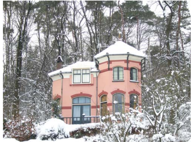
Villa Kastanjeoord is particulier bewoond. A.u.b. op gepaste afstand bezichtigen..

Hoger op de helling van de Ravenberg, op nummer 14, bevindt zich de niet alleen vanwege de kleur opvallende Villa Kastanjeoord.