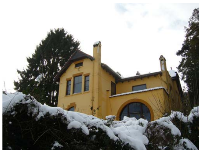
Villa particulier bewoond, a.u.b. op gepaste afstand bezichtigen.

Deze brandde door onoplettendheid van geallieerde troepen af terwijl ze bezig waren er iets te eten klaar te maken. Het pand bestond uit een woongedeelte voor de landgoedbeheerder en zijn gezin, een verblijf voor baron Van Randwijck en eventuele gasten, en een café met terras voor bijvoorbeeld wandelaars. In 1941 was de heerlijkheid Beek (in eigendom van het geslacht der baronnen Van Randwijck) aangekocht door de Stichting Geldersch Landschap. Na de oorlog werd op de plaats van de Ravenberg-Taveerne de woning gebouwd voor de boswachter in dienst van Geldersch Landschap. Architectenbureau G. Feenstra ontwierp het in 1950 in de stijl van de Delftse School. Volgens de architecten van de Delftse School lag schoonheid juist in eenvoud en was een goede harmonie tussen massa, ruimte en lichtval belangrijk. Architectuur moest “nederig” zijn en vooral niet opvallen en er werd veelal gebruik gemaakt van traditionele elementen, zonder dat in een gebouw letterlijk een historische situatie gekopieerd werd. De stijl is vlak voor de tweede wereldoorlog en in de wederopbouwperiode veel toegepast.