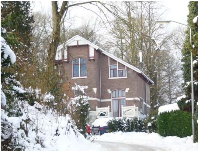
Villa particulier bewoond, a.u.b. op gepaste afstand bezichtigen.

Door een wegzakkende ondergrond heeft het pand veel te lijden gehad, maar het is nu in restauratie. Wellicht wordt tijdens de restauratie duidelijk met welke kleur of kleuren het pleisterwerk oorspronkelijk beschilderd is geweest.