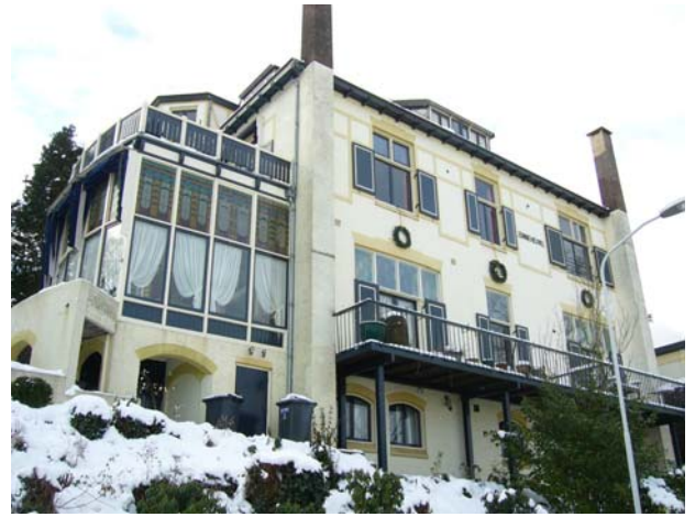
NB. Zonneheuvel en Bijou worden particulier bewoond. A.u.b. op gepaste afstand bekijken.

Verder vallen op de fraai op de hoeken van het hoge schilddak geplaatste schoorstenen en de torenachtige uitbouw met metselwerk in de trant van vakwerk. De muren zijn geschilderd in twee tinten okergeel. Het pand heeft nog meer prachtige details, zoals in de hekwerken van smeedijzer en hout, de glas-in-lood bovenlichten en in de deuren.