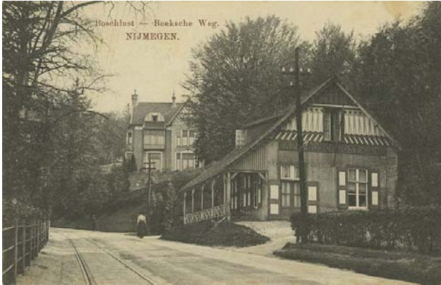
Rijksstraatweg in 1915. Café Boschlust met op de achtergrond Villa Dennenheuvel. De toenmalige bewoners van de villa zouden het café overigens laten slopen omdat het hun uitzicht bedierf.

Enkele voorbeelden zijn Concertgebouw De Vereniging en Museum Kam, maar ook Jachtslot De Mookerheide, de voormalige synagoge in de Gerard Noodtstraat in Nijmegen (nu Natuurmuseum) en de Israelitische begraafplaats op de Kwakkenberg. Daarnaast enkele bankgebouwen en veel winkelpanden in Nijmegen, zoals de voormalige ABN Bank in de Hertogstraat en het in de oorlog verwoeste warenhuis Vroom en Dreesmann.